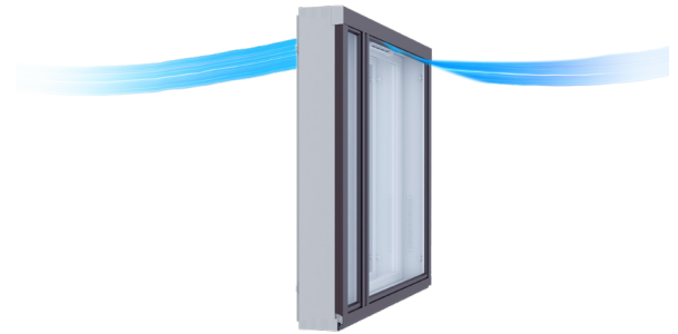
Lämpimällä säällä raikas tuloilma virtaa suoraan venttiilin läpi.