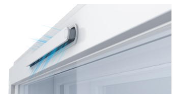
Raikas ilma virtaa tasaisesti sisäpuiteeseen asennetusta avoimesta venttiilistä.